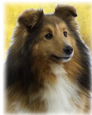
Sheltie (shetland) du Cèdre Enchanté