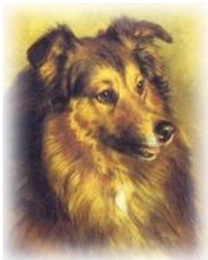
« Rough Collie » par Franck Paton

Le berger Shetland a souvent été considéré comme un colley miniature en raison de sa ressemblance flagrante avec ce dernier (cf. portrait du « rough Collie » peint par Franck Paton (1856-1909) et photo du Shetland). Cependant le Shetland n'est en rien une race « naine » comme l'atteste l'harmonie de ses formes.